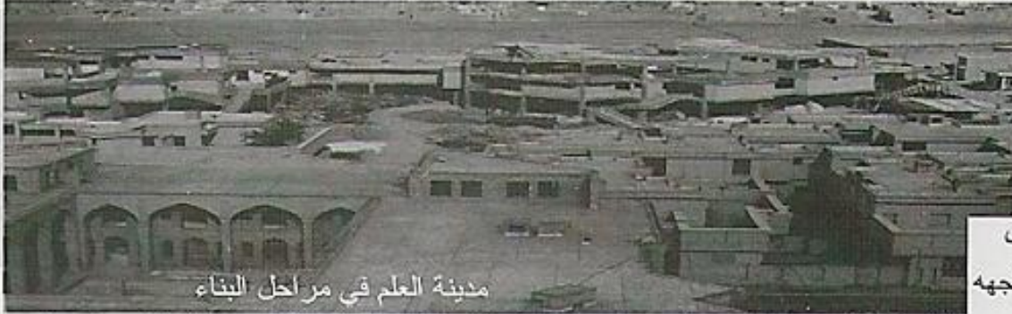
مدينة العلم في مراحل البناء

حتى أكملت الأجزاء الرئيسية من المشروع سنة ١٣٦٠هـ.ش/١٩٧٩م حيث بدأ إسكان الروحانيين في البيوت المخصصة للسكن وبوشر بتقديم الخدمات اللازمة لهم. وهنا يجدر الإشارة الى أن الدور السكنية تحتوي